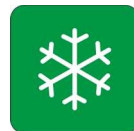
NEVE A BASSA QUOTA